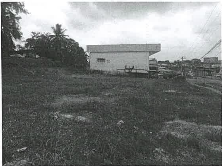
Imagen 6: estructura administrativa Fecha: 04-05-2022