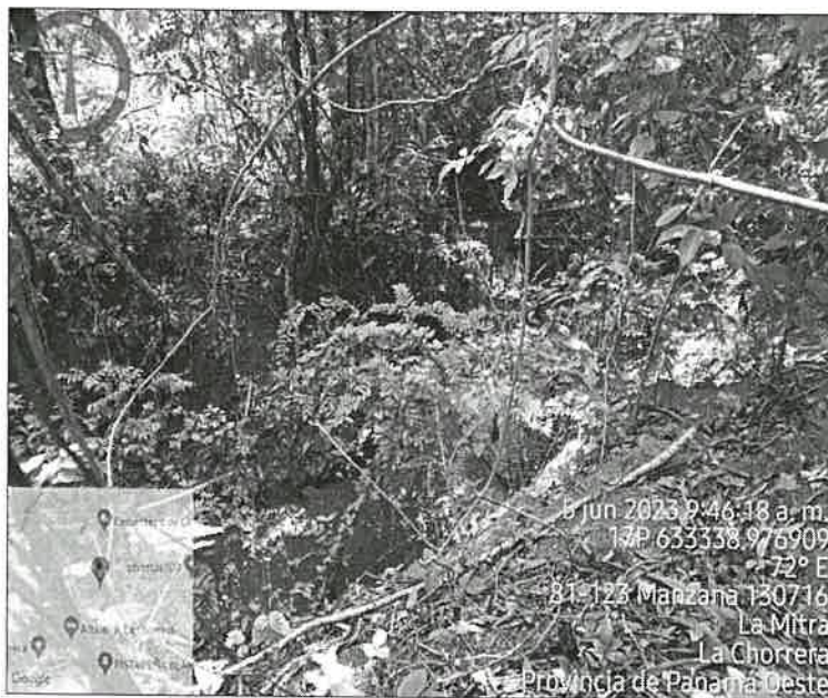
Imagen 3. Recurso Hídrico. Existe una fuente hídrica (quebrada Sin Nombre) que atraviesa el polígono del proyecto y será el punto de descarga de la PTAR. Según Informe Técnico No. DRPO-SSH-108-2023, de la Sección de Seguridad Hídrica, menciona que "Que dentro del área del proyecto de la zona Noreste a la zona Suroeste, discurre un tramo de un (1) cuerpo de agua, (Quebrada Sin Nombre). Coordenadas UTM WGS 84 633350 m E, 976898 m N". (Fotografía tomada el 05/06/2023)

Imagen 1 y 2. La Topografía , del polígono es plana, inclinada a ligeramente inclinada, con pendientes de 0-20%. (Fotografía tomada el 05/06/2023)