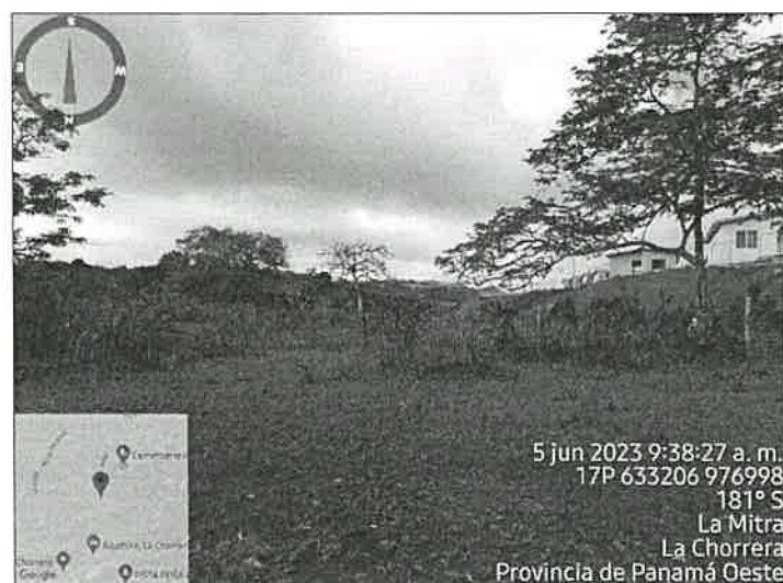
Imagen 6. En cuanto a la Fauna Silvestre , se observa que por el tipo de vegetación el sitio no es propicio para el hábitat de animales silvestres. Según Informe de inspección técnica SAPB N° 102-2023, de la Sección de Biodiversidad, menciona que: “Fauna Silvestre: Al momento de la inspección solo se observó algunas aves transitorias” . (Fotografía tomada el 05/06/2023).

Imagen 4 y 5. La Vegetación , que compone el polígono es característica de una finca con potrero, que ha sido intervenida por actividades agropecuarias, como la cría de ganado vacuno. Según Informe Técnico No. 177-2023, de la Sección Forestal, menciona que: “El globo de terreno donde se pretende desarrollar el proyecto, posee vegetación tipo gramíneas, rastrojo y mantiene bosque de galería a orillas de la quebrada sin nombre, donde se señala en el Estudio, que se realizará una obra en cauce” . (Fotografía tomada el 05/06/2022)