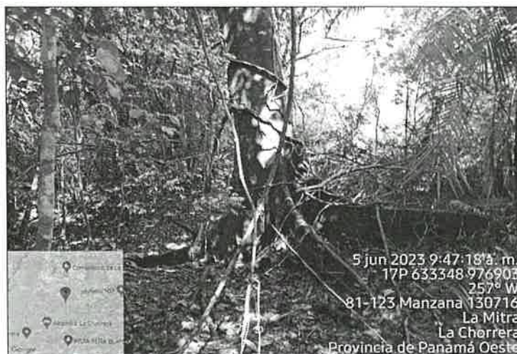
Imagen 4 y 5. La Vegetación , que compone el polígono es característica de una finca con potrero, que ha sido intervenida por actividades agropecuarias, como la cría de ganado vacuno. Según Informe Técnico No. 177-2023, de la Sección Forestal, menciona que: “El globo de terreno donde se pretende desarrollar el proyecto, posee vegetación tipo gramíneas, rastrojo y mantiene bosque de galería a orillas de la quebrada sin nombre, donde se señala en el Estudio, que se realizará una obra en cauce” . (Fotografía tomada el 05/06/2022)