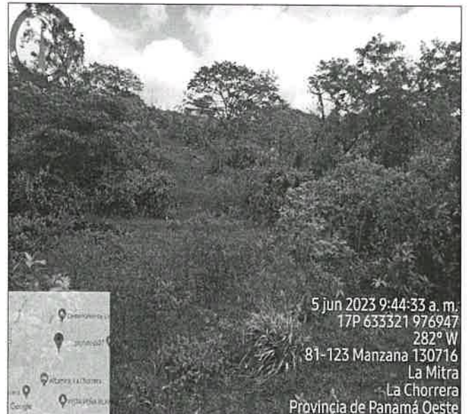
Imagen 1 y 2. La Topografía , del polígono es plana, inclinada a ligeramente inclinada, con pendientes de 0-20%. (Fotografía tomada el 05/06/2023)