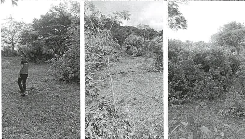
AQUÍ SE PUEDE VER EL TIPO DE VEGETACIÓN PRESENTE

Calle Panamericana, Ave. De Las Américas, Frente al MOP, arriba de Agro centro, Tel: 500 08 55 ext. 6427