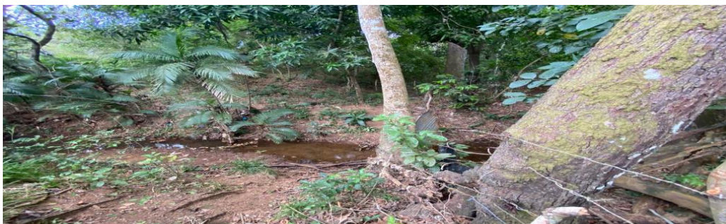
Quebrada sin nombre