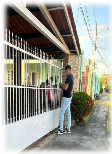
Foto Personas encuestadas