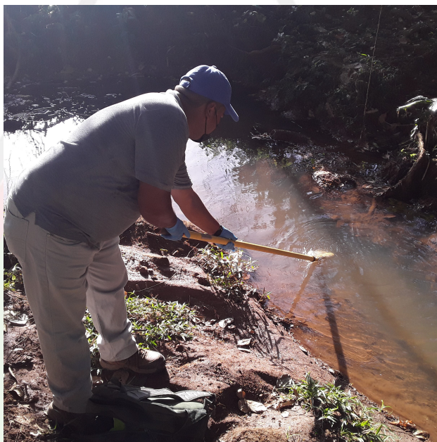
Monitoreo de Agua natural de Río Perequetecito

Imágenes de Monitoreo Agua Natural, para: MAC INSTRUMENTS INDUSTRY INC., para el proyecto: Urbanización Colina Del Viento