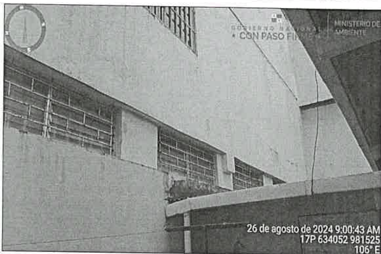
Imagen 5 y 6. El sitio donde se desarrollará el proyecto, es un zona completamente urbana, concurrida, y altamente transitada, ubicada en el área comercial del distrito, por lo que cuenta todos los servicios básicos , como agua potable suministrada por el IDAAN, red de distribución de energía eléctrica e internet, transporte público y selectivo (buses y taxis), vías de acceso asfaltada.