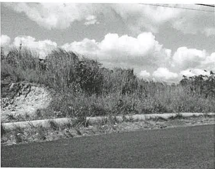
Imágenes: 2: parte frontal del polígono del proyecto. Fecha: 01-03-2023