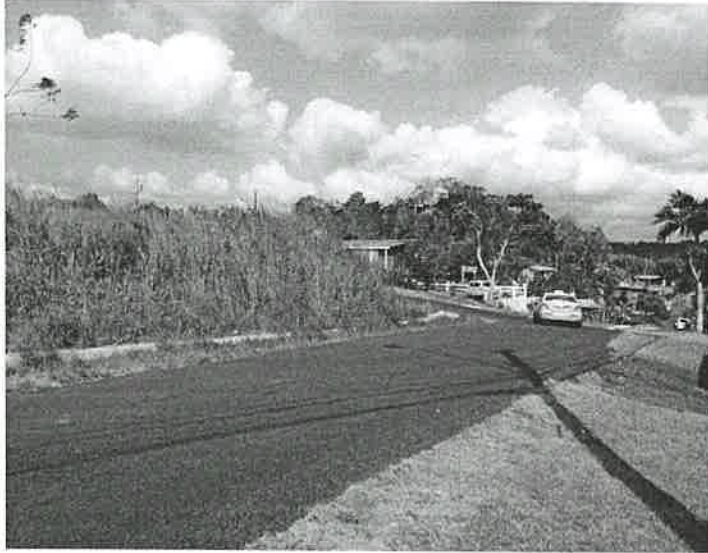
Imagen: 3: vista lateral derecha y su colindancia con la Calle Celso Cedeño. Fecha: 01-03-2023