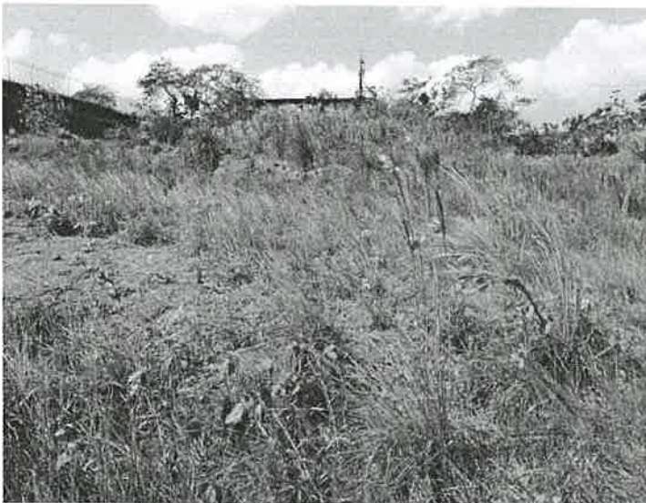
Imagen: 4, visual de la vegetación existente compuesta en su totalidad por un estrato herbáceo (gramínea), asociado a fragmentos de suelo desnudo. Fecha: 01-03-2023