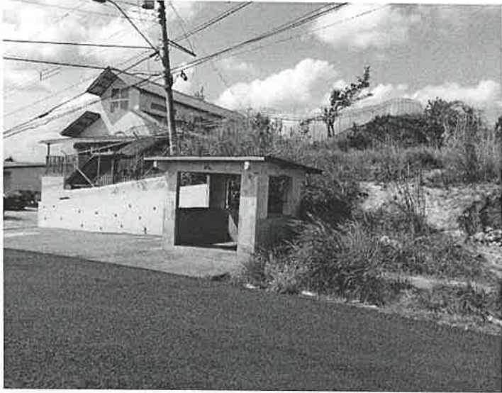
Imágenes: 1: vista lateral de una de las esquinas del terreno y su colindancia con el colegio secundario San Martín de Porres, se observa la caseta principal de transporte público del sector conocido como la Revolución Final. Fecha: 01-03-2023