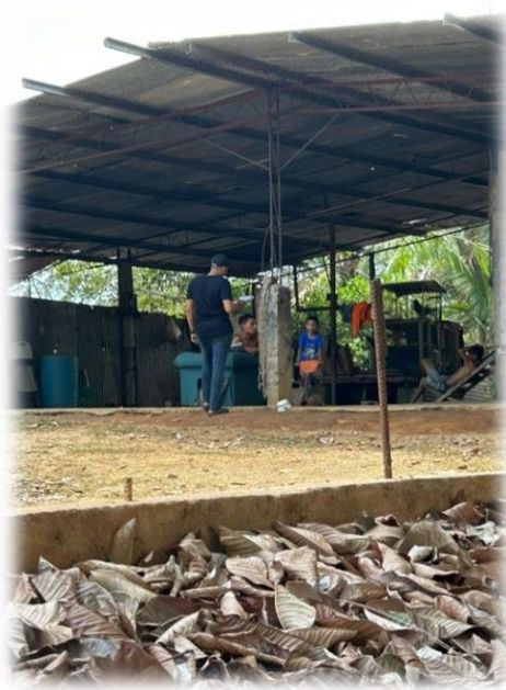
Foto de algunas Personas encuestadas