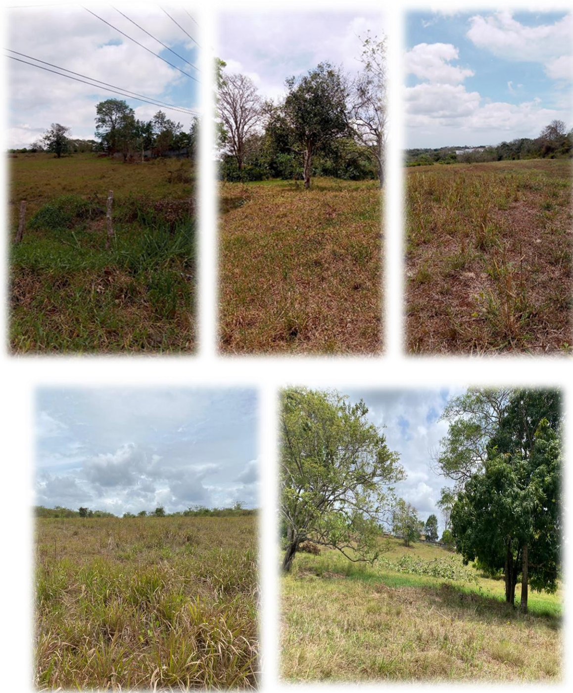
Gramineas y Árboles dispersos