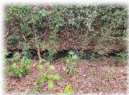
En esta área es donde se colocará el tubo de 36”