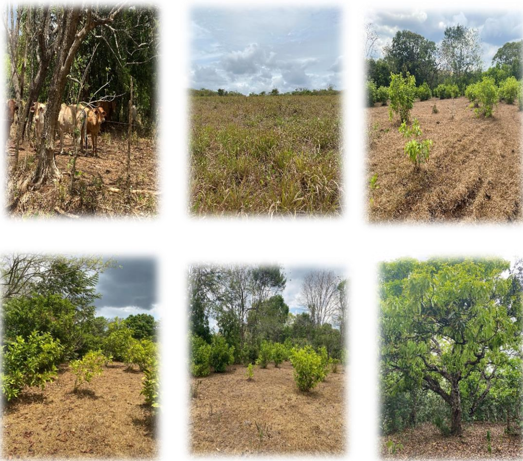
Gramineas, rastrojo joven y Arboles dispersos