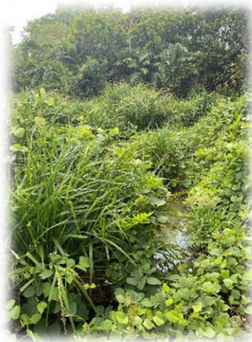
Drenaje de flujo estacional