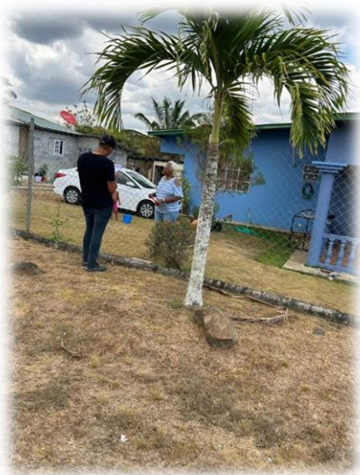
Foto de algunas Personas encuestadas