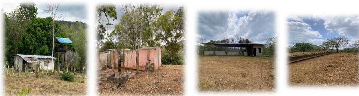
Estructuras a Demoler