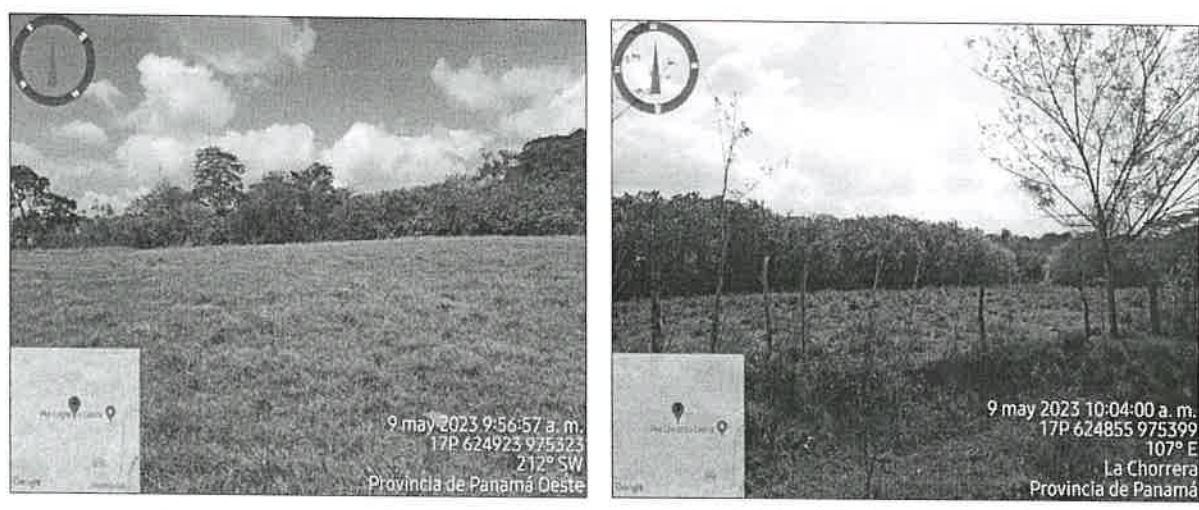
Imagen 5 y 6. Vegetación tipo gramínea, bosque secundario joven (rastrojo) y cerca viva dentro del polígono del proyecto.