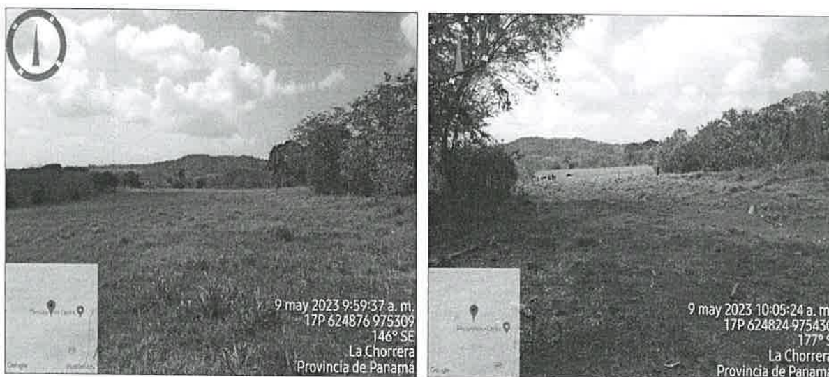
Imagen 1 y 2. Pendiente plana e inclinada del polígono.