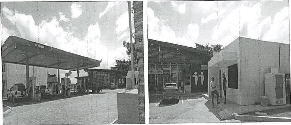
Imagen 1 y 2. Estación de combustible Terpel existente, que será remodelada o adecuada, con la instalación de 2 canopy, 3 surtidoras de combustible, 9 estacionamientos adicionales, entre otras actividades. En sus alrededores existente comercios y supermercados, es un área que cuenta con todos los servicios básicos (agua, luz, transporte, internet).

Se realizó recorrido por el polígono del proyecto a impactar observando lo siguiente: