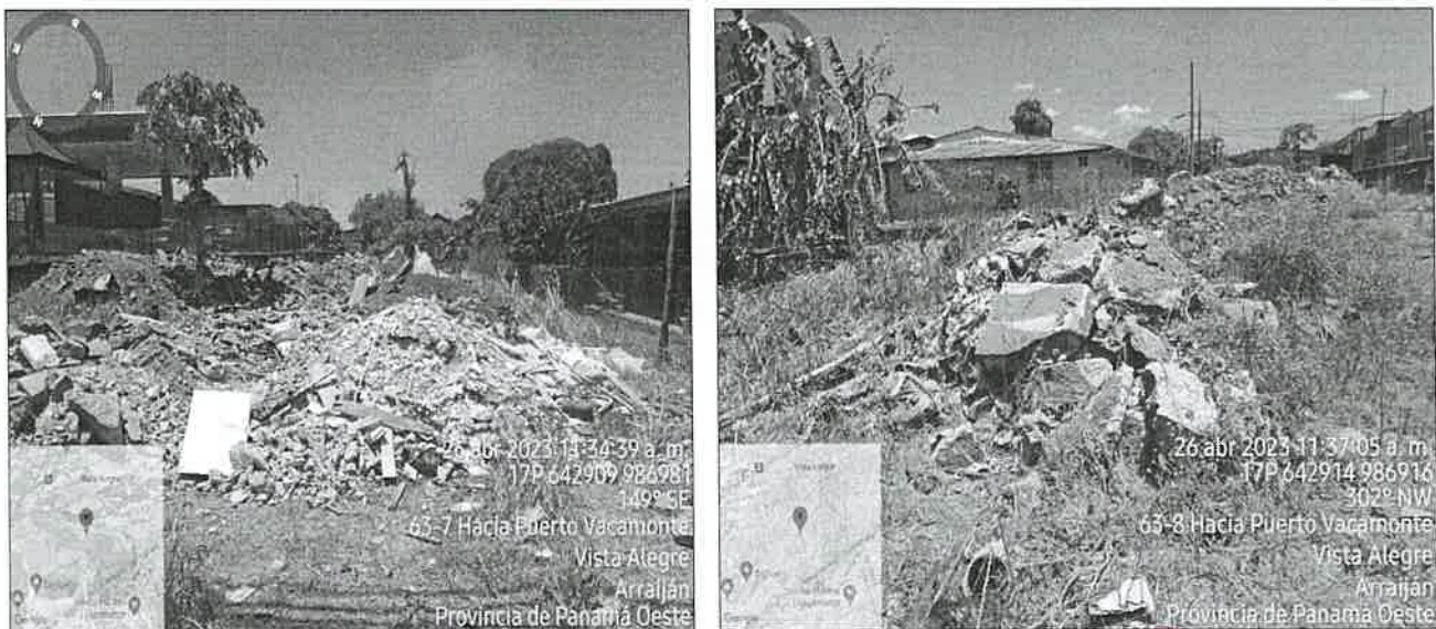
Imagen 1 y 2. Polígono del proyecto con restos de caliche, acumulación de tierra y gramínea.

El área donde se ubica el polígono y desarrollará el proyecto, cuenta con los servicios básicos como calle de asfalto, energía eléctrica, agua potable, internet. Colindante al mismo, existe una estación de combustible y al otro costado una vivienda.