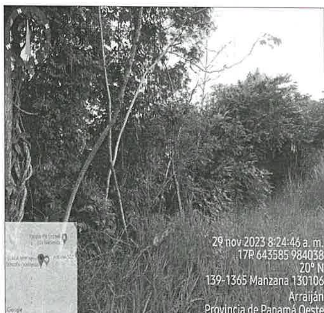
Imagen 4. Se observa el bosque de galería de la quebrada Limones , colindante con el polígono, el mismo se mantiene. No se observó fauna silvestre en el lugar.