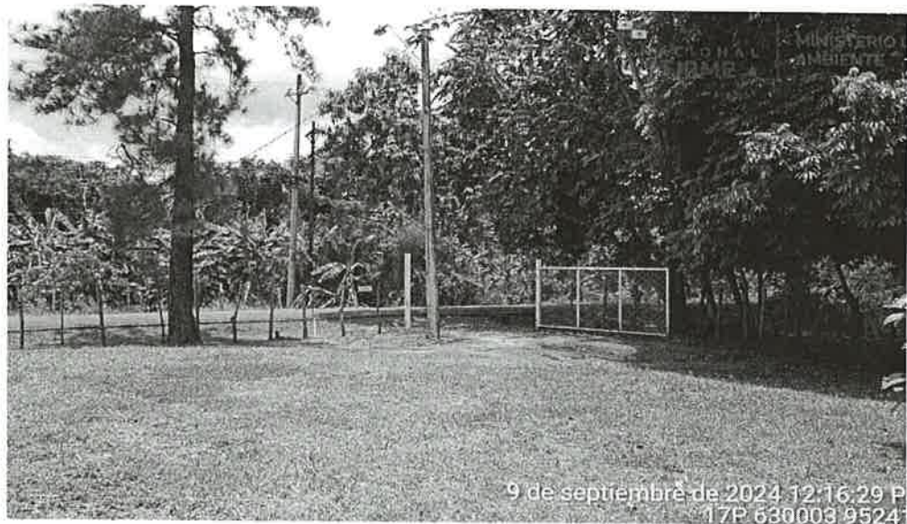
Imagen 3, Entrada al polígono del proyecto el cual mantiene cerca con estacas vivas, gramíneas y árboles dispersos.