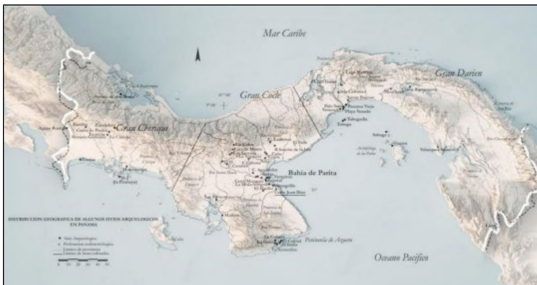
Ilustración 2: Mapa de zonas arqueológicas de Panamá