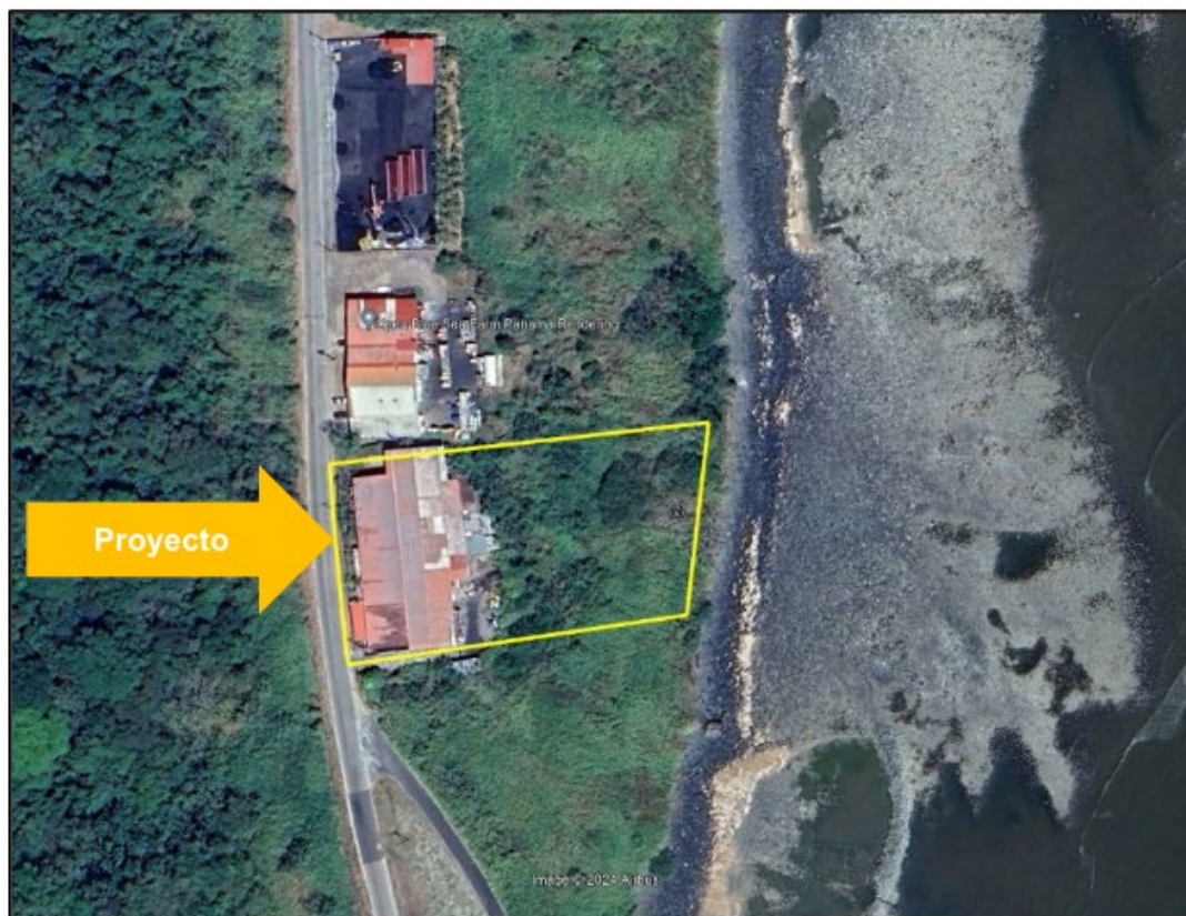
Ilustración 1. Polígono del proyecto