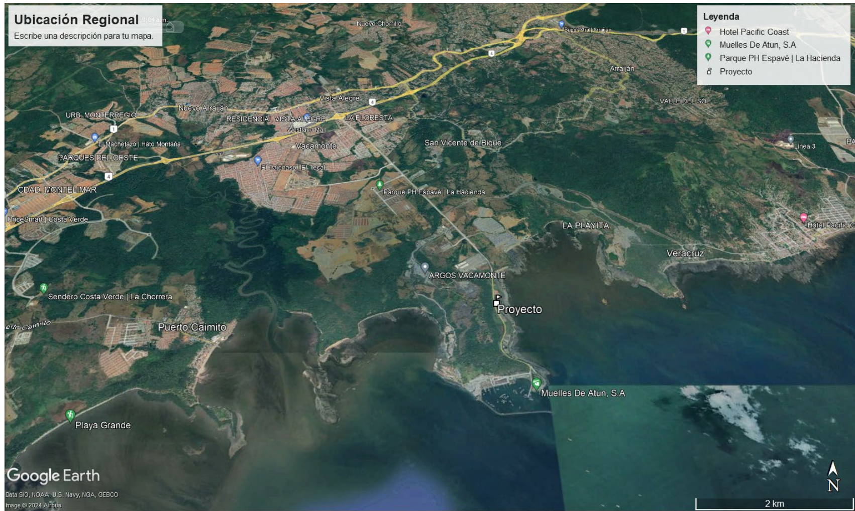
Mapa 1: Ubicación Regional