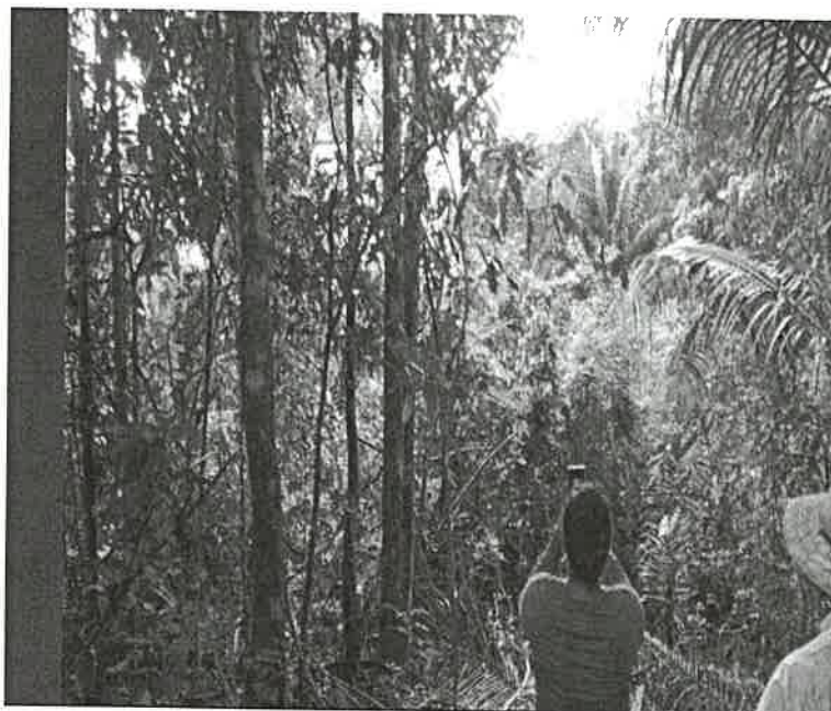
Imagen 1, 2, 3, 4 El polígono cuenta con vegetación de gramíneas, rastrojo, árboles dispersos en donde predomina espavé, palma real, cachito, guarumo, posee una topografía irregular a plana.