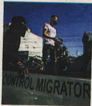
AFP | Operativo migratorio.

AFP | El gobierno de República Dominicana anunció un plan de "ejecución inmediata" para deportar 10.000 haitianos indocumentados por semana, en una nueva medida para intentar controlar la migración irregular de su país vecino", dijo el vocero de la presidencia, Homero Figueroa.