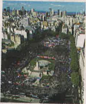
AFP | Foto aérea de protesta.

AFP | Estudiantes y profesores universitarios argentinos se manifiestan en contra del ajuste económico del gobierno del presidente Javier Milei, decidido a vetar una ley aprobada recientemente por el Congreso que busca mejorar el presupuesto de las altas casas de estudio.