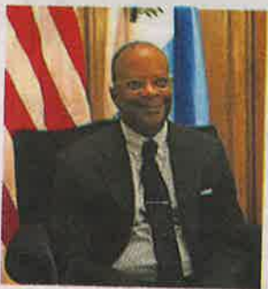
ML | Todd Robinson.

AFP | Estados Unidos destinará 50 millones de dólares adicionales a un programa de fortalecimiento de la seguridad y justicia en Guatemala, informó el subsecretario de la Oficina Internacional de Narcóticos y Aplicación de la Ley, Todd Robinson. "Coincidimos en muchas prioridades claves, desde la lucha contra el narcotráfico hasta la lucha contra la corrupción y la seguridad fronteriza", añadió Robinson.