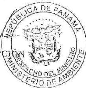
MILCIADES CONCEPCIÓN Ministro de Ambiente