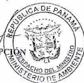
MILCIADES CONCEPCIÓN Ministro de Ambiente