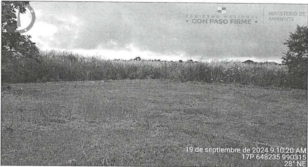
Imagen 1, 2 y 3. Vista del terreno donde se propone desarrollar el proyecto. Fotografías tomada s el día 19/9/2024.