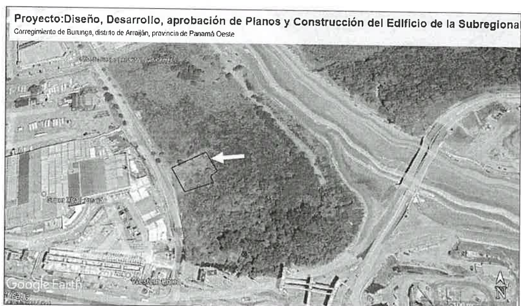
Ubicación del proyecto.