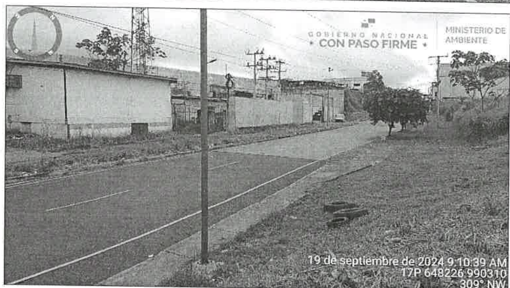
Imagen 4 y 5. Vistas de la parte frontal del polígono, se observa la construcción de la Línea 3 del Metro, carretera asfaltada y parte trasera y depósitos del Supermercado Xtra. Fotografías tomadas el día 19/9/2024.