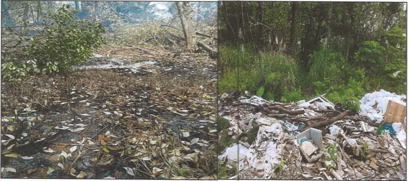
POLÍGONO UTILIZADO PARA DISPOSICIÓN DE DESECHOS PROVOCANDO CONTAMINACIÓN AMBIENTAL- COLEGIO Y URBANIZACIONES 20 METROS AL FRENTE