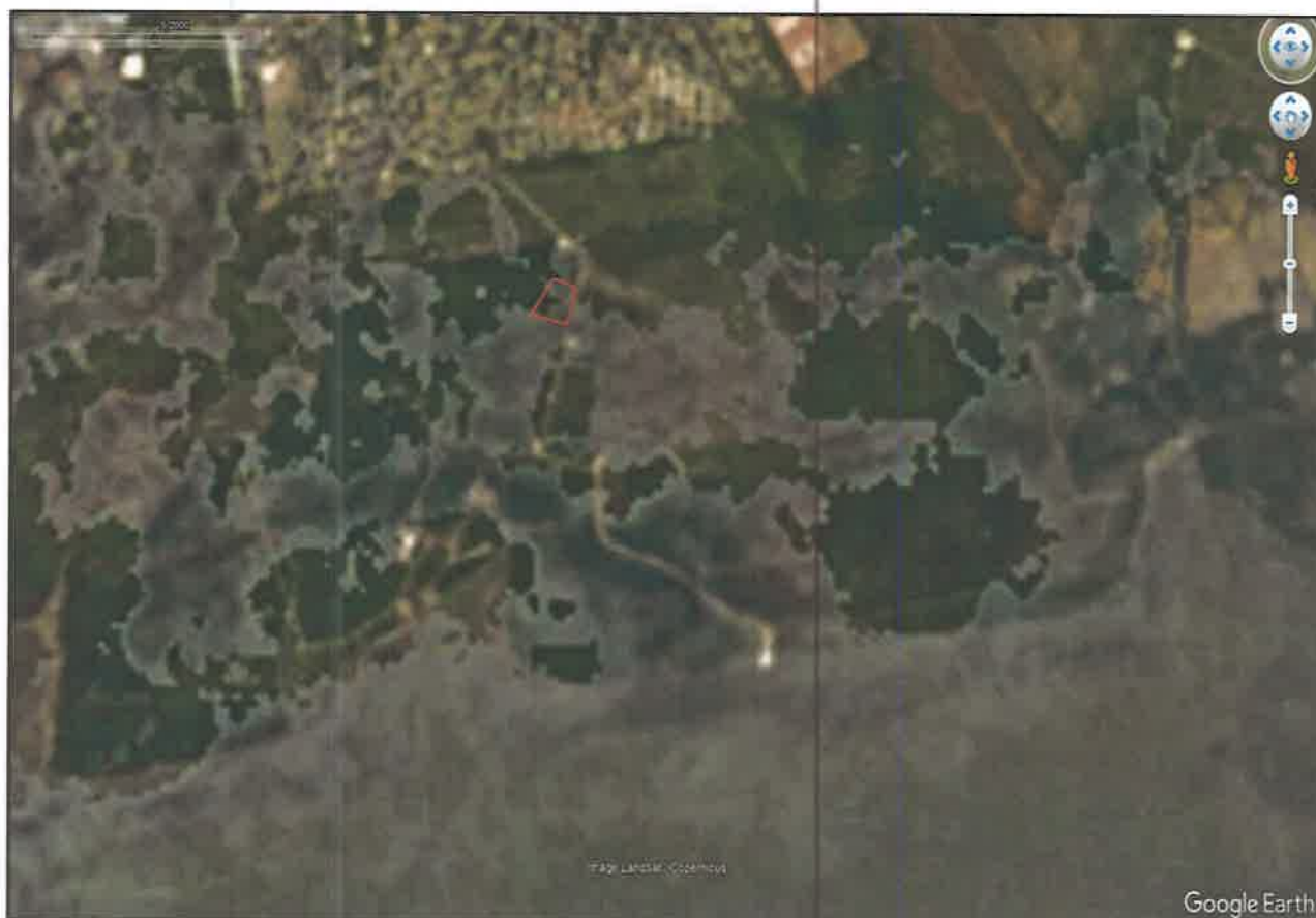
Imagen #1: Vista aérea área de desarrollo del proyecto (polígono rojo), fuente: Google Earth imagen satelital, año 2000.