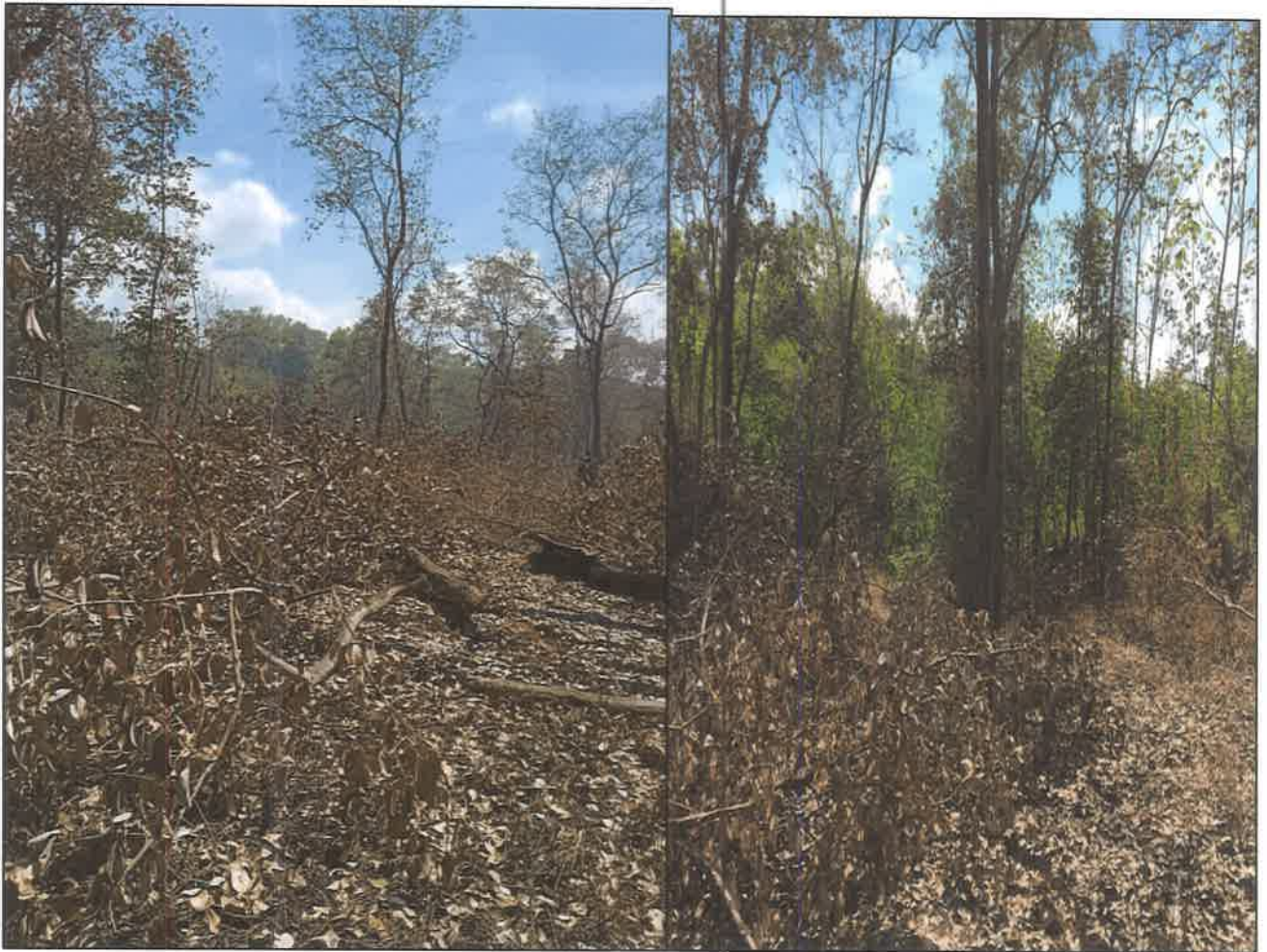
INCENDIO DEL TERRENO REPORTADO A MI AMBIENTE MEDIANTE NOTA DE 18 DE ABRIL DE 2023 EN NUESTRO POLÍGONO.