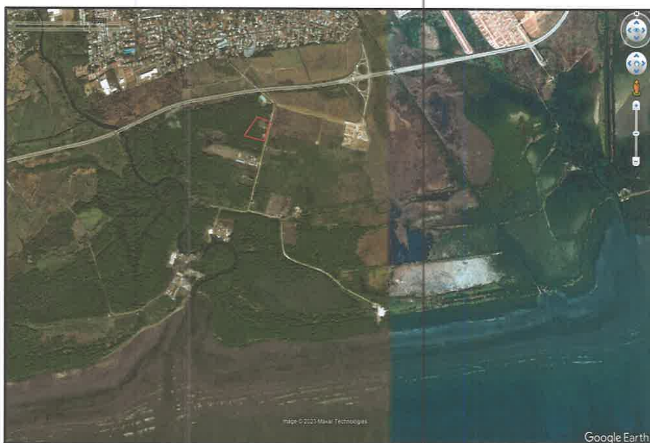
Imagen #2: Vista aérea área de desarrollo del proyecto (polígono rojo), fuente: Google Earth imagen satelital, año 2005.