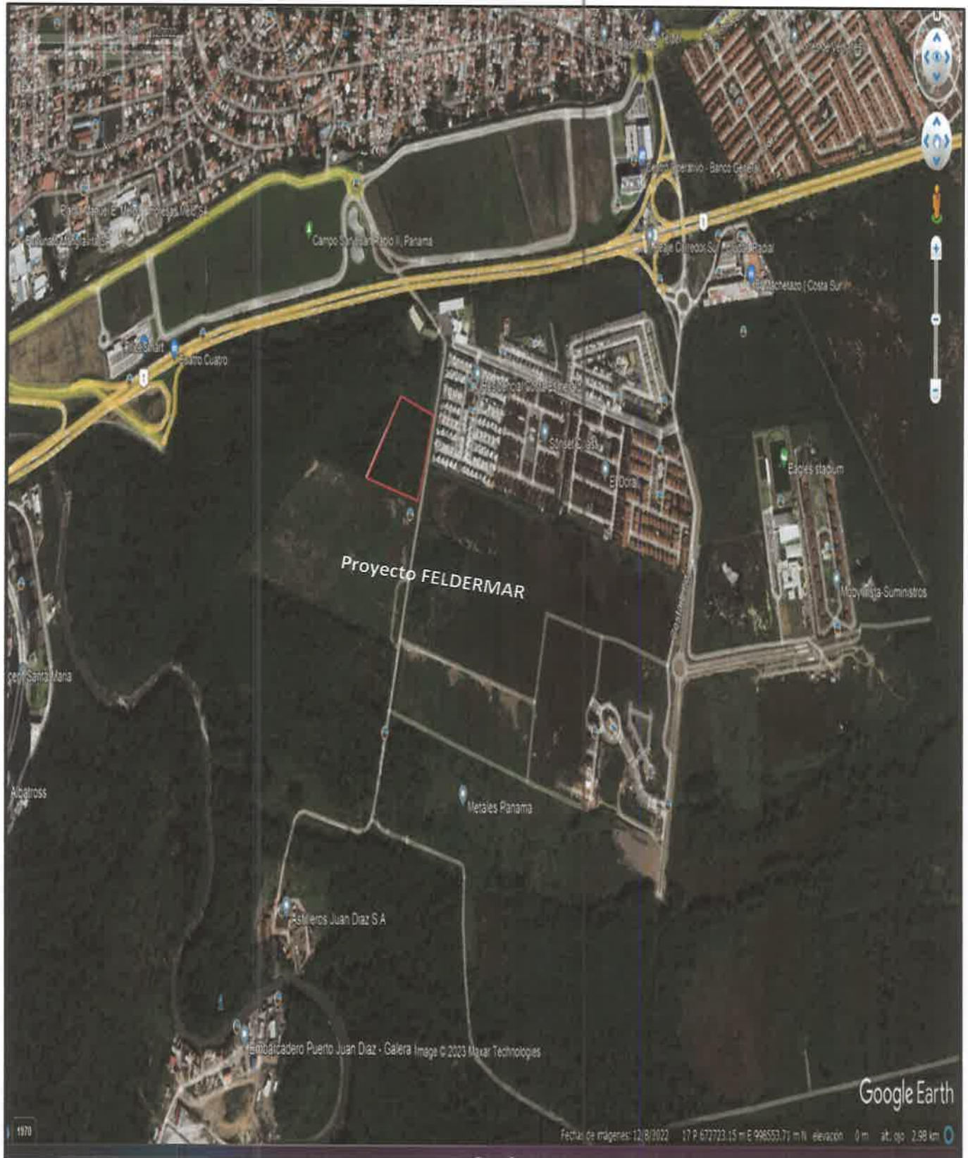
Imagen #3: Vista aérea área de desarrollo del proyecto (polígono rojo), fuente: Google Earth imagen satelital, año 2022.