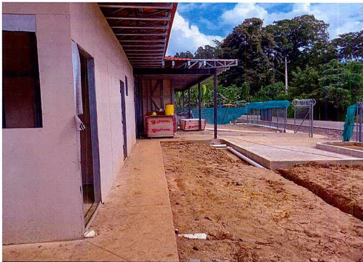
Figura No.2 Vista Lateral del Proyecto.