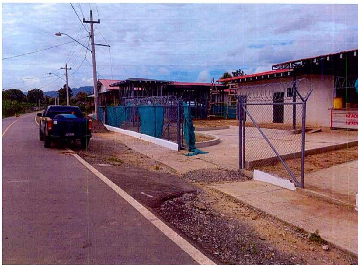
Figura No. 1. Vista del Ambiente Físico, donde se desarrollará el Proyecto.