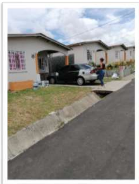
Fotos de algunas personas encuestadas