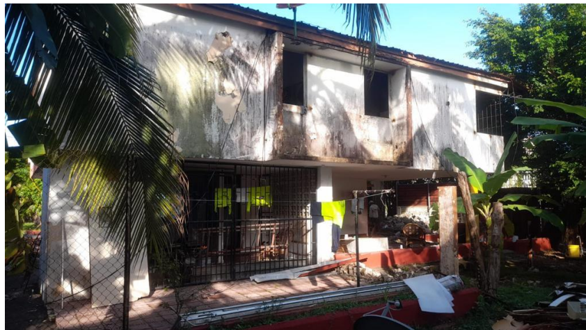
Dentro del área del proyecto