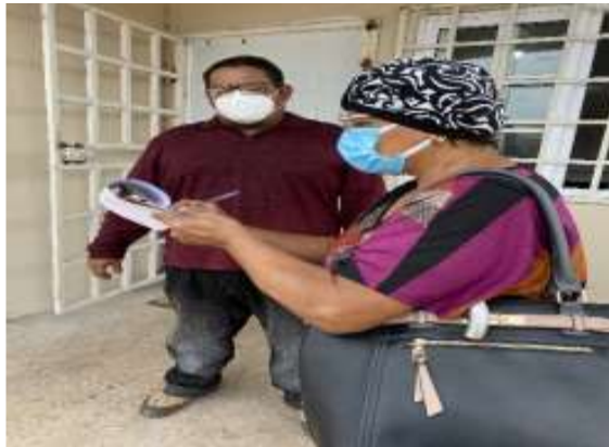
Foto de algunas Personas encuestadas