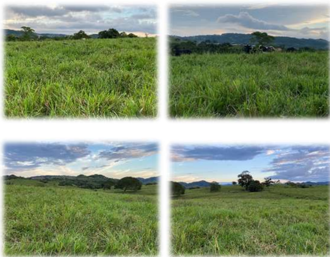
Gramineas y Arboles dispersos