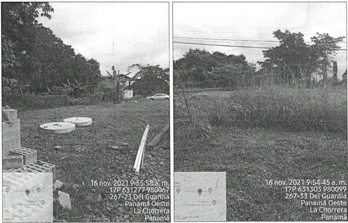
Imagen 1 y 2. Área del desarrollo del proyecto y se observa la vegetación compuesta por gramínea. Fecha: 16/11/2021.

Al realizar la revisión del documento de Estudio de Impacto Ambiental y lo observado en la inspección de campo se determina la siguiente ampliación y su justificación: