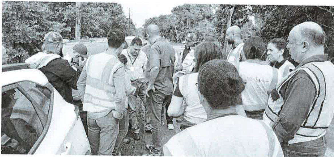
Foto No.2: Funcionarios que participaron en la inspección de Campo

Foto No.1: Se observa grupo de funcionarios verificando mapas del proyecto.