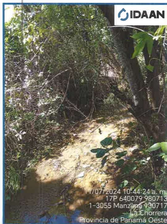
Fotografía N° 3 Fuente hídrica sobre la cual se realizará descarga de la PTAR.

Panamá, 12 de noviembre de 2024 Nota No. 132-DEPROCA-2024