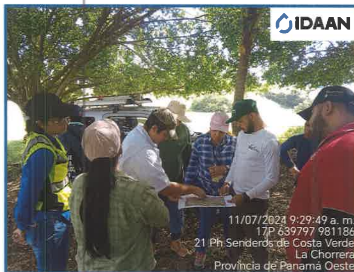
Fotografía N° 1 Punto de encuentro y planificación de los sitios a recorrer.