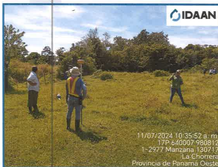
Fotografía N° 2 Punto de ubicación de la PTAR.