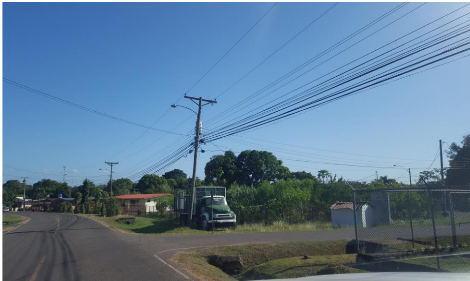
Vista del área del lote donde se desarrollará el proyecto