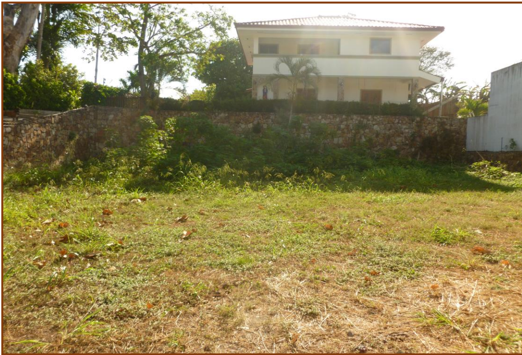
Vista general del terreno