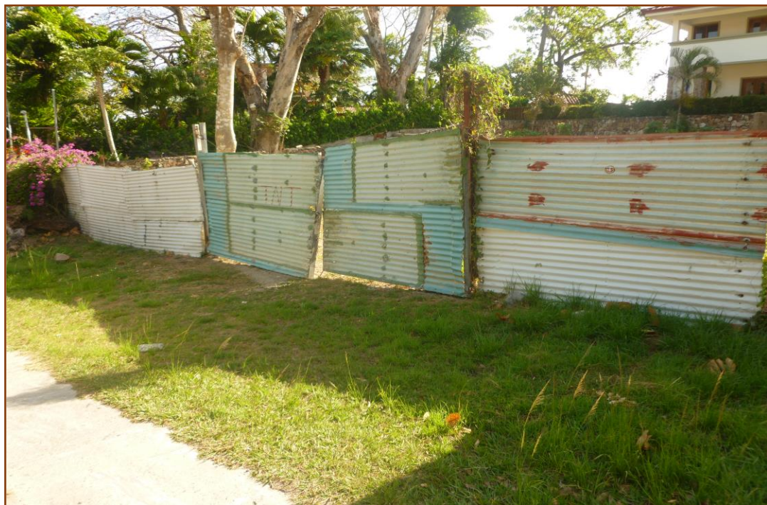
Vista dela parte frontal del terreno cercado con zinc