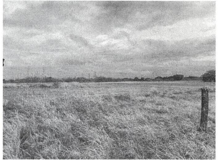
Fig. 1 y 2: Vista general del área del proyecto