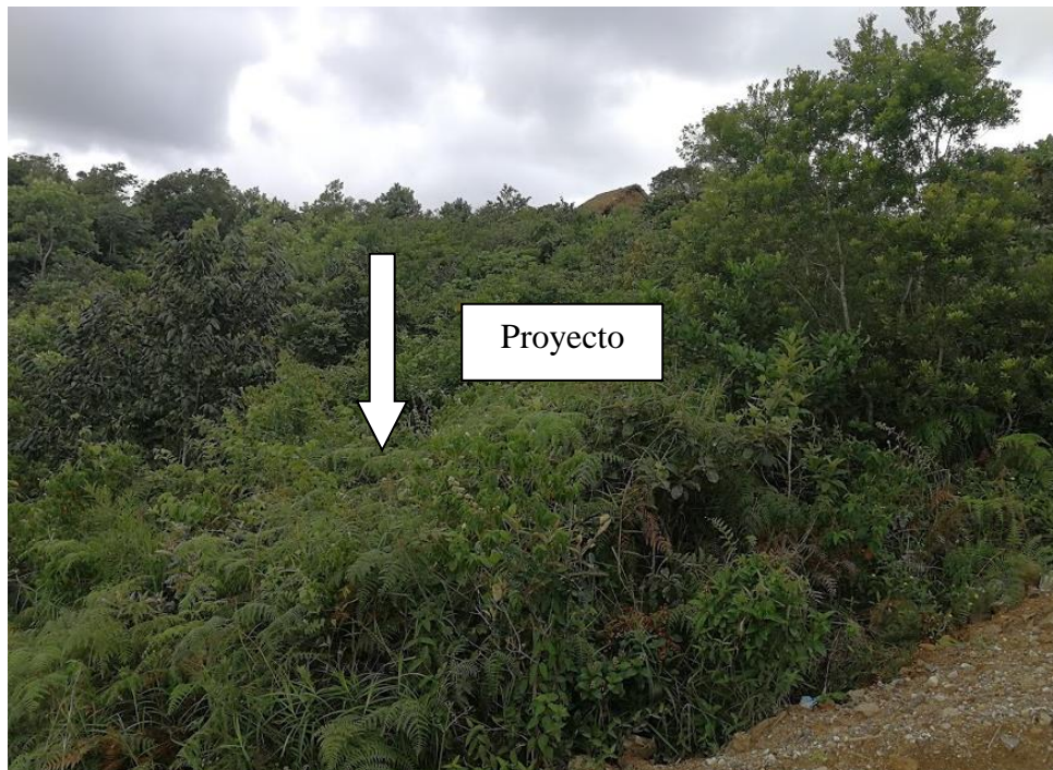
Figura No 6-1 Panorámica del Área de Ubicación del Proyecto

El área del proyecto se encuentra dentro del área perimetral del proyecto Parque Eólico Toabré, por lo que la actividad que se va a desarrollar es concordante con el uso de suelo del área.