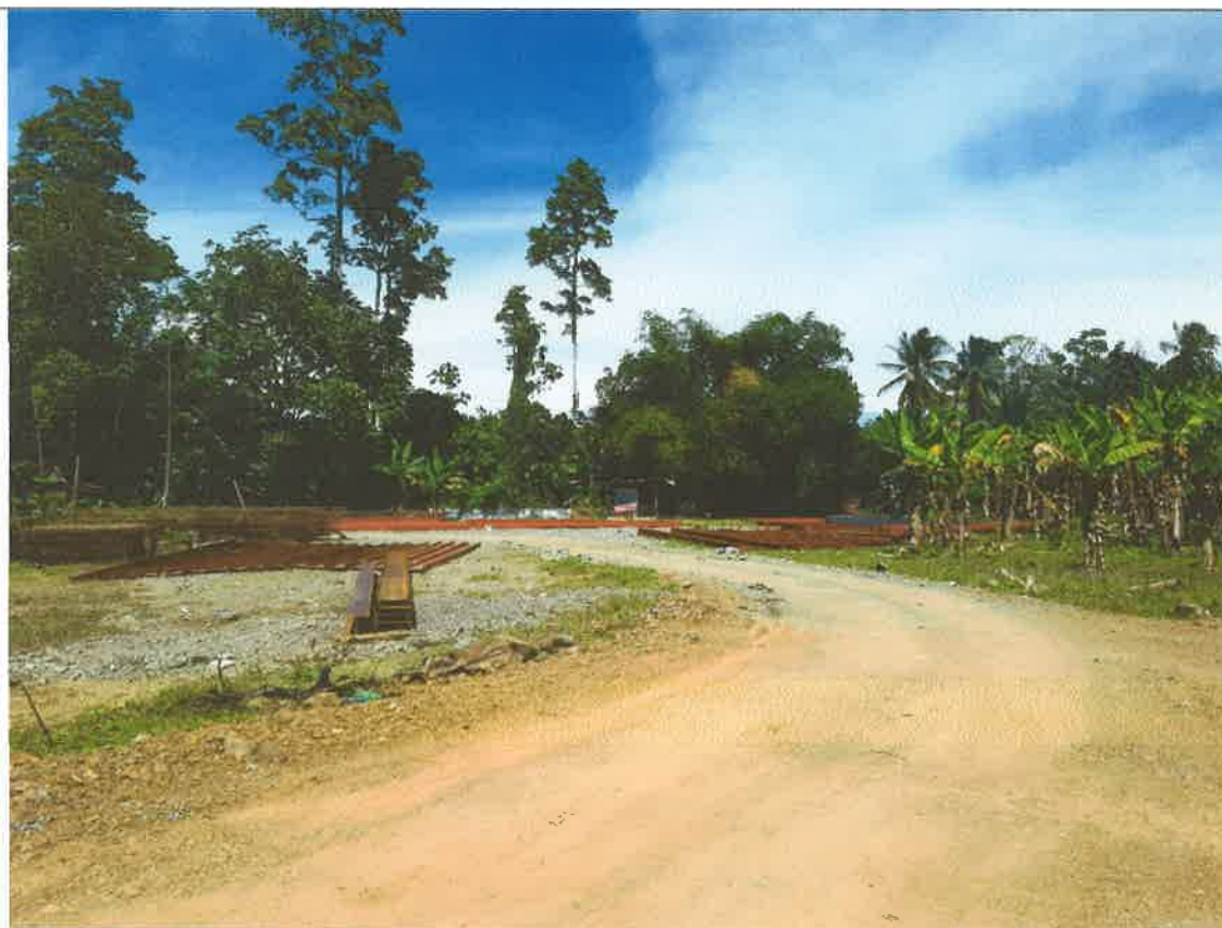
Vista del sitio del proyecto (WGS84/UTM zona 17N_ 323082 E_ 1050327 N)