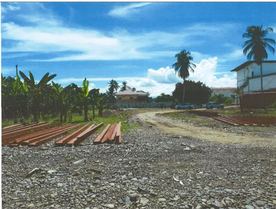
Vista del sitio del proyecto (WGS84/UTM zona 17N_ 323082 E_ 1050327 N)