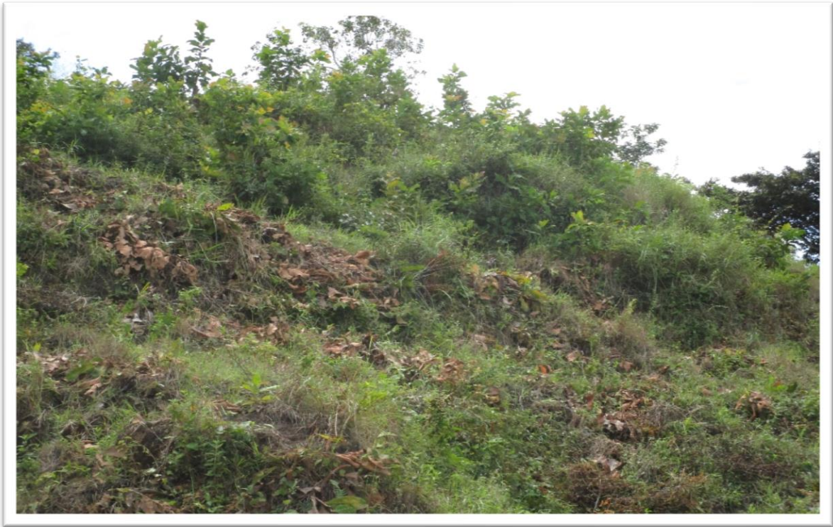
FOTO 2. VISTA DEL TERRENO DONDE SE DESARROLLARÁ EL PROYECTO.