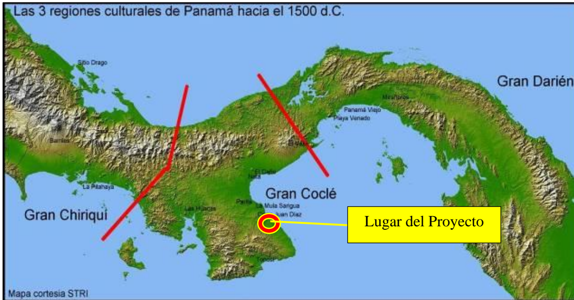
Figura 3. Ubicación de sitios arqueológicos y división de las Regiones culturales de Panamá durante la Época Prehispánica.