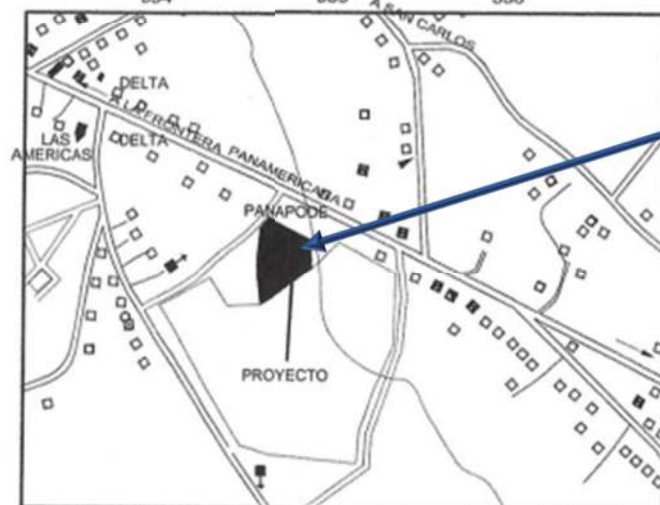
DETALLE DE AMARRE ESCALA: 1:7,500