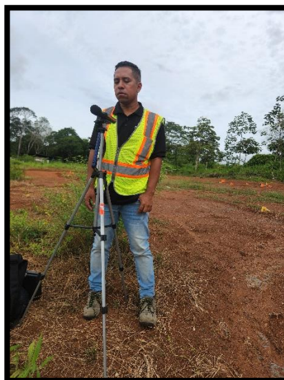
Punto # 1: POLÍGONO DEL PROYECTO