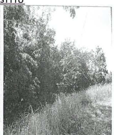
En esta imagen: "UN CONSIDERABLE PORCENTAJE DEL TERRENO DESTINADO PARA ESTE PROYECTO, MANTIENE ESTE TIPO DE VEGETACIÓN". Foto tomada por Isaac Espinosa M., martes, 6 de diciembre de 2022.