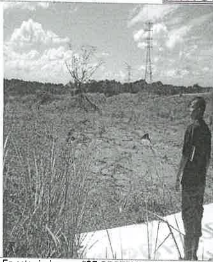
En estas imágenes: "SE OBSERVA EL PERSONAL EN PLENA EVALUACIÓN DEL PROYECTO; SE OBSERVA EL CONTRASTE DE LA VEGETACIÓN EXISTENTE EN EL SITIO, EN EL MOMENTO DE LA DILIGENCIA". martes, 6 de diciembre de 2022.