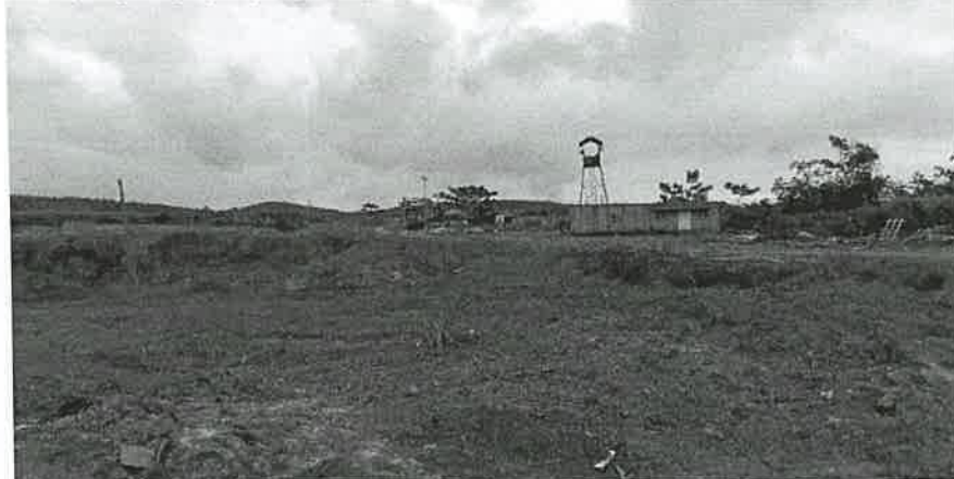
Evidencia fotográfica del sitio