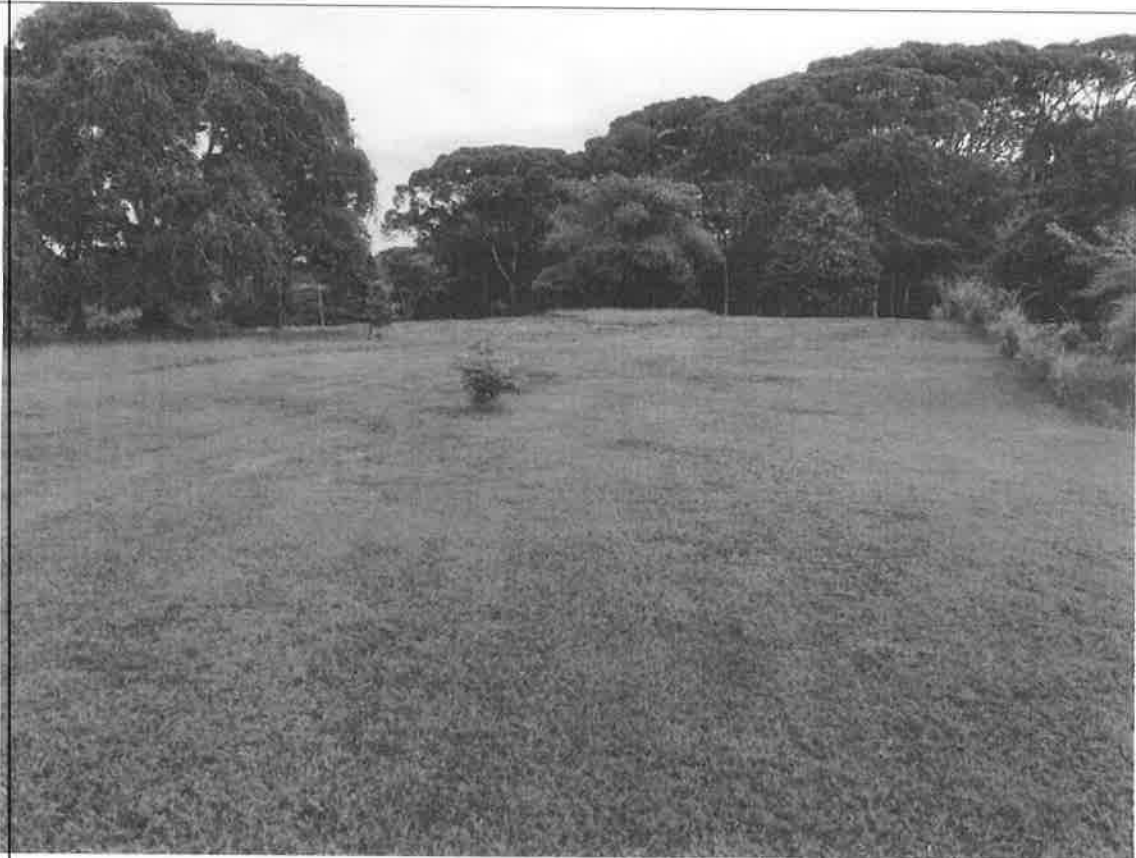
Vista del sitio del proyecto, Edificio Principal y Edificio de habitaciones.