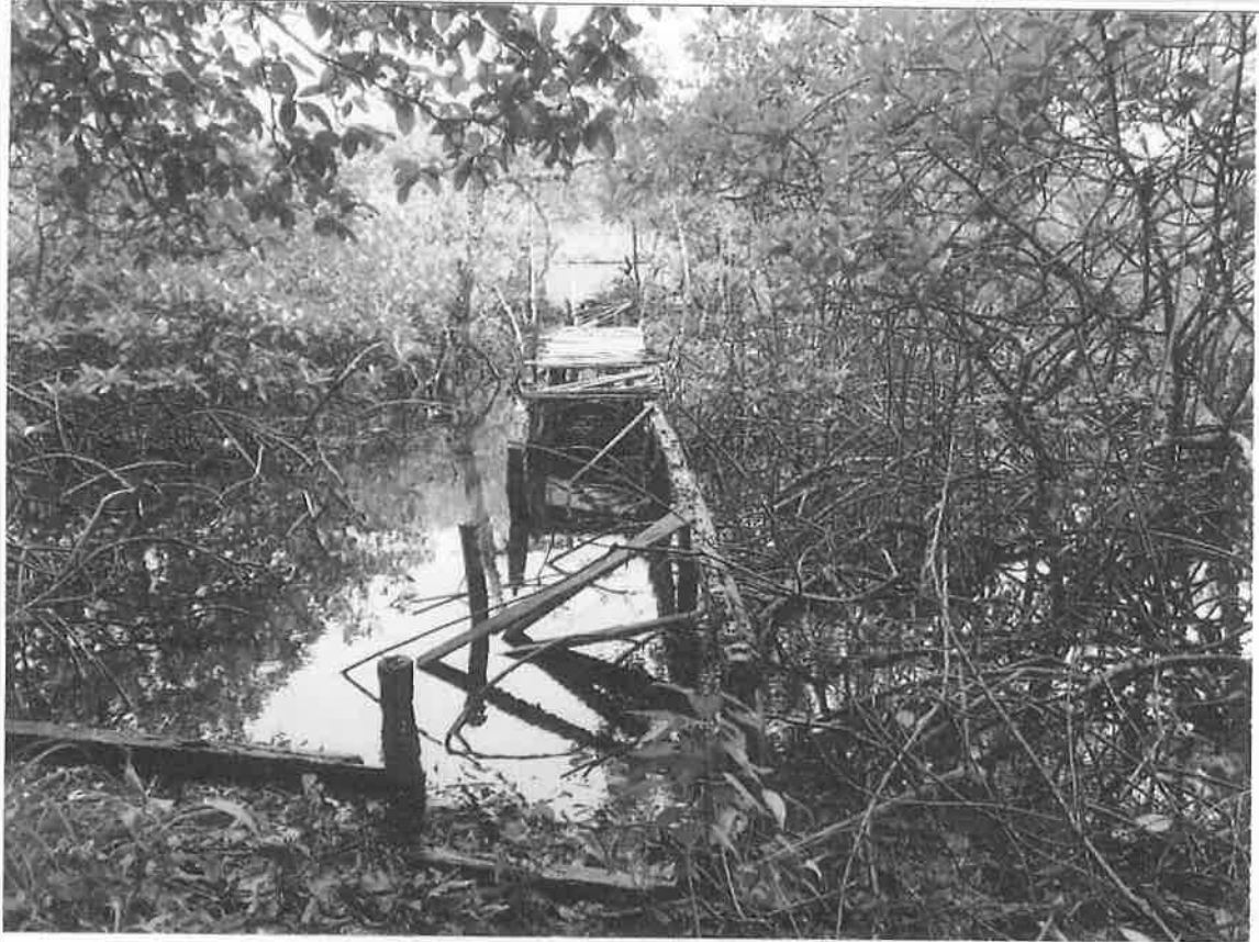
Vista del sitio del proyecto, Atracadero 2.