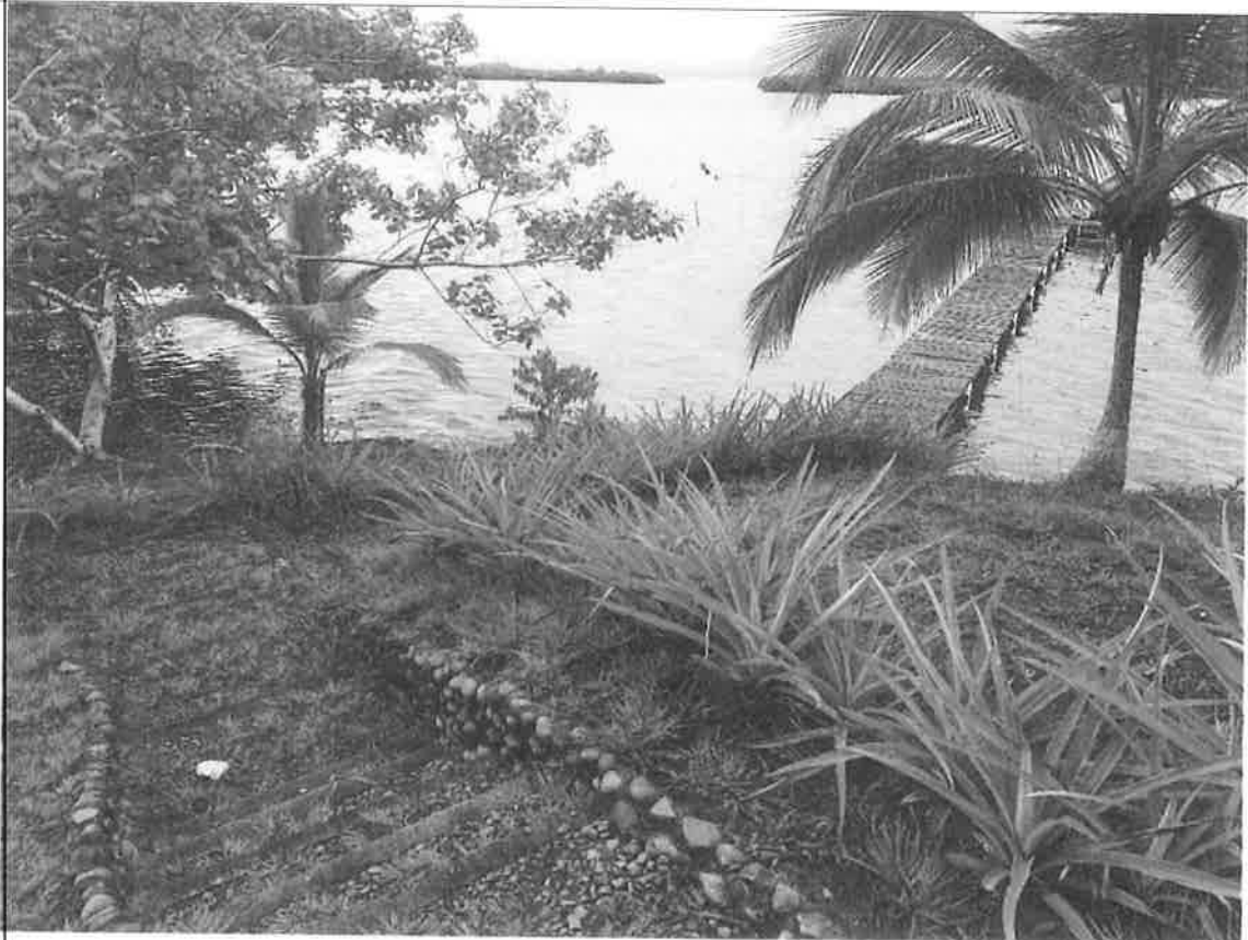
Vista del sitio proyecto, Atracadero 1.