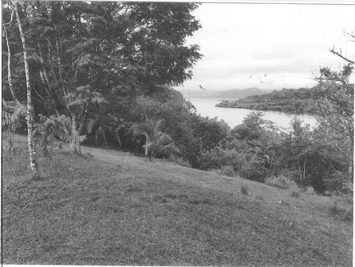
Vista del sitio del proyecto, ubicación de los ocho Bungalows o cabañas.