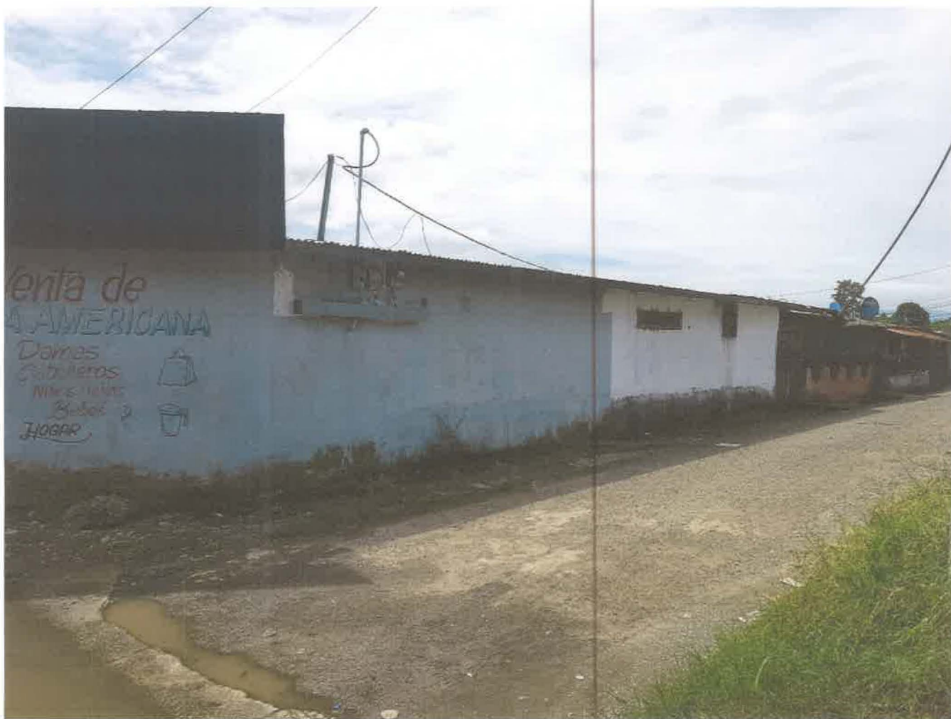
Vista del sitio del proyecto. Se observa la infraestructura existente de un solo nivel.