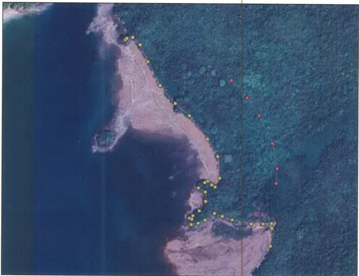
Figura N° 1. Vista de la delimitación de la franja de vegetación establecida por la Ley N° 2 de 7 de enero de 2006 (200 m desde la LAMO).