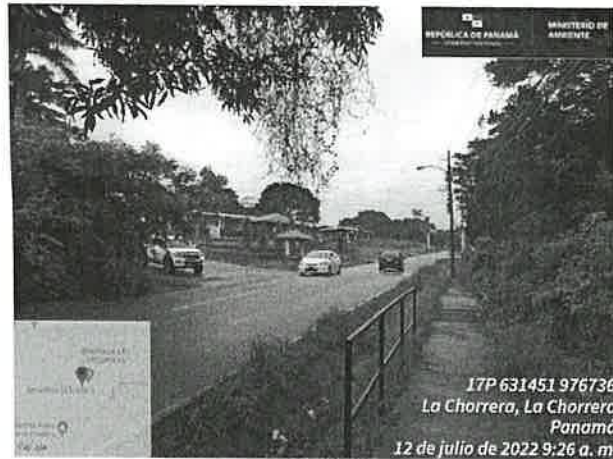
Imagen 4, muestra algunos de los servicios públicos que hay en el área.