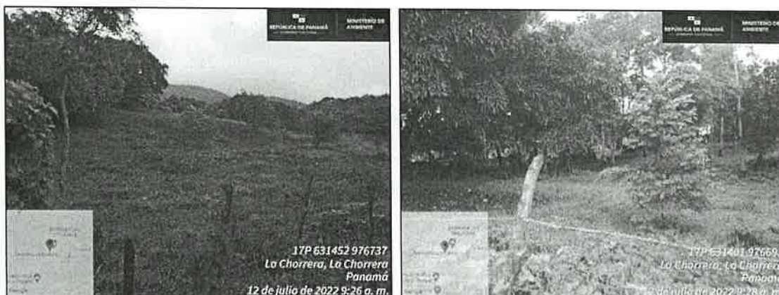
Imagen 1 y 2, muestra la vegetación en el área donde se desarrollará el proyecto.