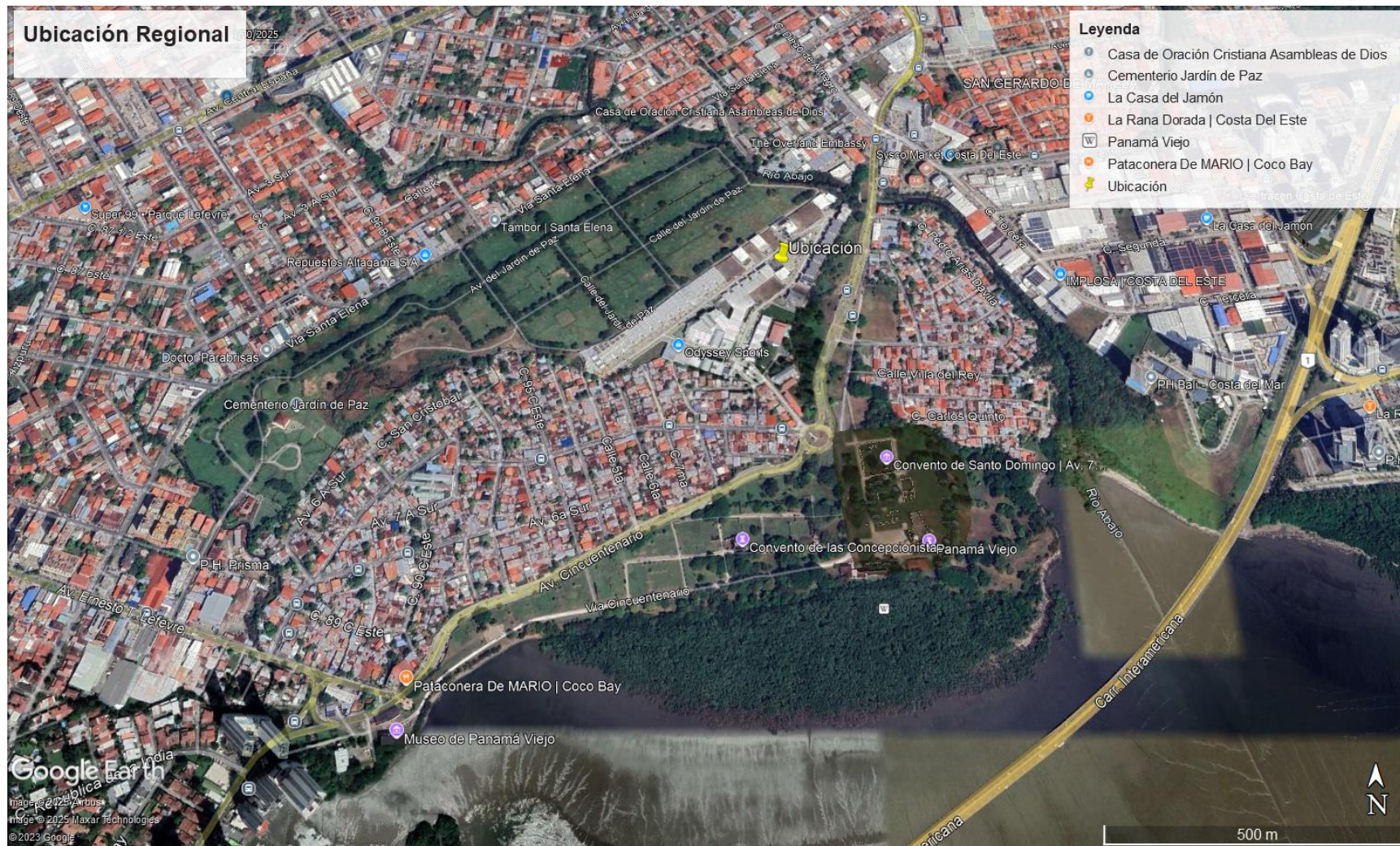
Ilustración 1: Ubicación Regional