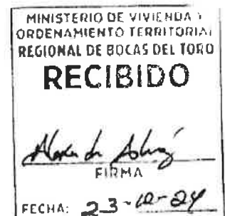
Ariety Soto Coffre Propietaria