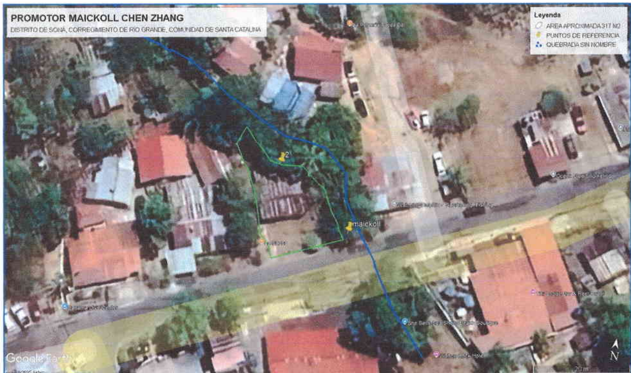
FOTO GOOGLE EARTH DEL ÁREA DE SERVIDUMBRE DE LA QUEBRADA S/N

Proyecto de Remodelación y Ampliación Edificio Maickoll Distrito de Soná – Santa Catalina Fecha: 23/1/2025