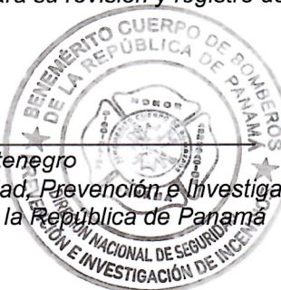
Mayor Liborio Montenegro