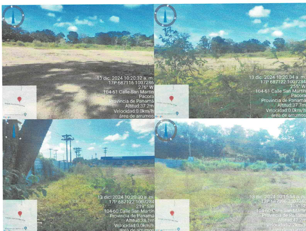
Fotos N°1, 2, 3, 4, 5, 6, 7, 8, 9, 10, 11, 12, 13, 14, 15, 16, 17, 18, 19, 20, 21, 22, 23 y 24: Vista general. Tramo prospectado. El terreno prospectado es semiplano, cubierto de tierra y césped, con árboles y postes de luz eléctrica, delimitado por una cerca artificial.

El siguiente cuadro muestra las coordenadas tomadas durante la prospección arqueológica: