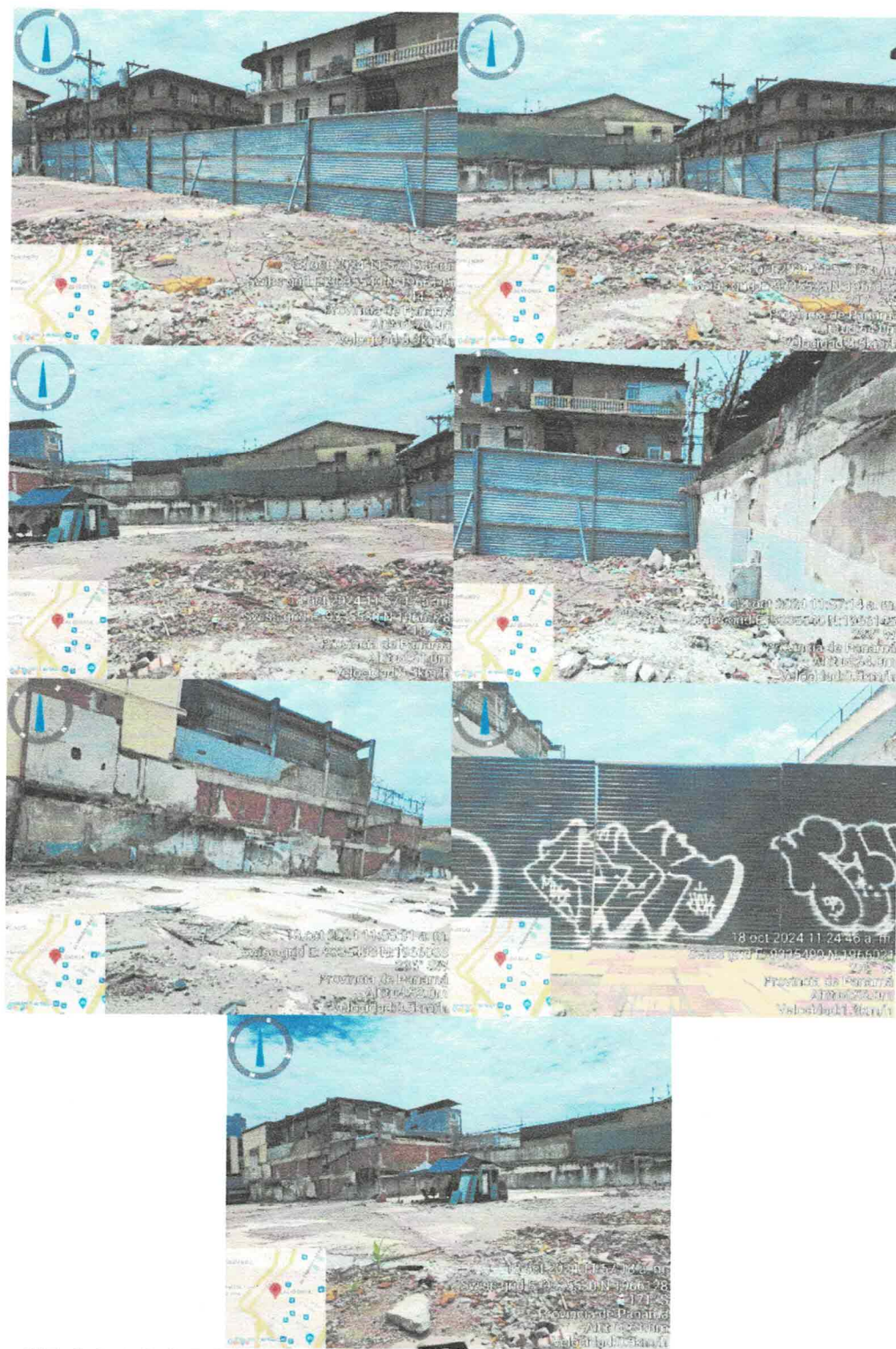
Fotos N°1, 2, 3, 4, 5, 6, 7, 8, 9, 10, 11, 12, 13, 14, 15, 16, 17, 18, 19, 20, 21 y 22: Vista general. Tramo prospectado. El terreno prospectado se encuentra en una zona urbana, con una superficie plana de concreto y restos de materiales de construcción. Colinda con edificaciones modernas y está delimitado por una cerca artificial.