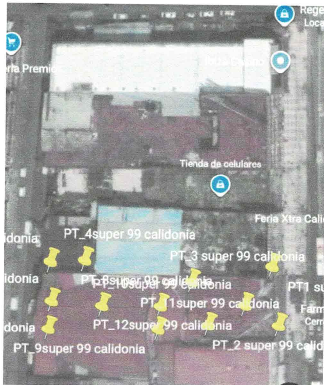
Vista Satelital N° 1. Proyecto SUPER 99 DE CALIDONIA