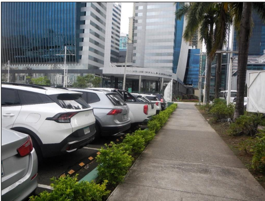
Fotos 10 y 11. Vista del terreno de proyecto, espacio cerrado con el piso de asfalto y de concreto, en su entorno edificios altos.