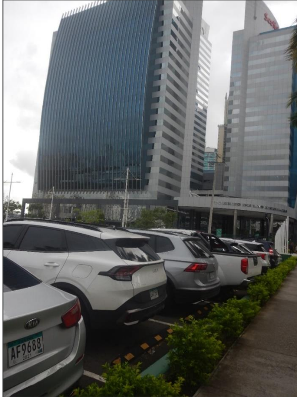
Fotos 4 y 5. En la fotografía observamos el piso rellenado con gravilla y compactado con asfalto, para el uso de estacionamientos de autos.