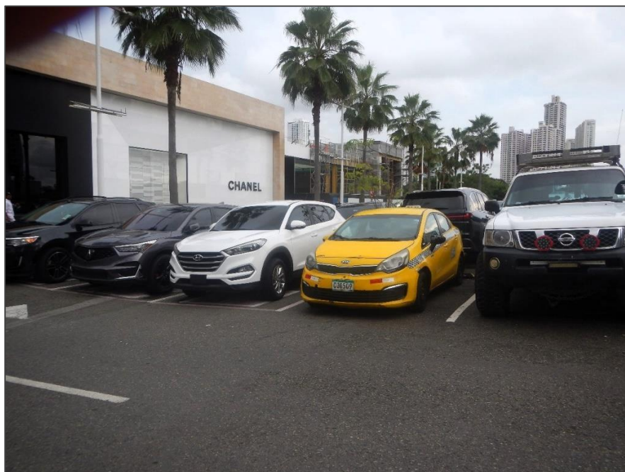
Fotos 6 y 7. En las siguientes fotografías se aprecian en un sector del área de proyecto, el piso de asfalto que está siendo utilizado para estacionamiento de automóviles.