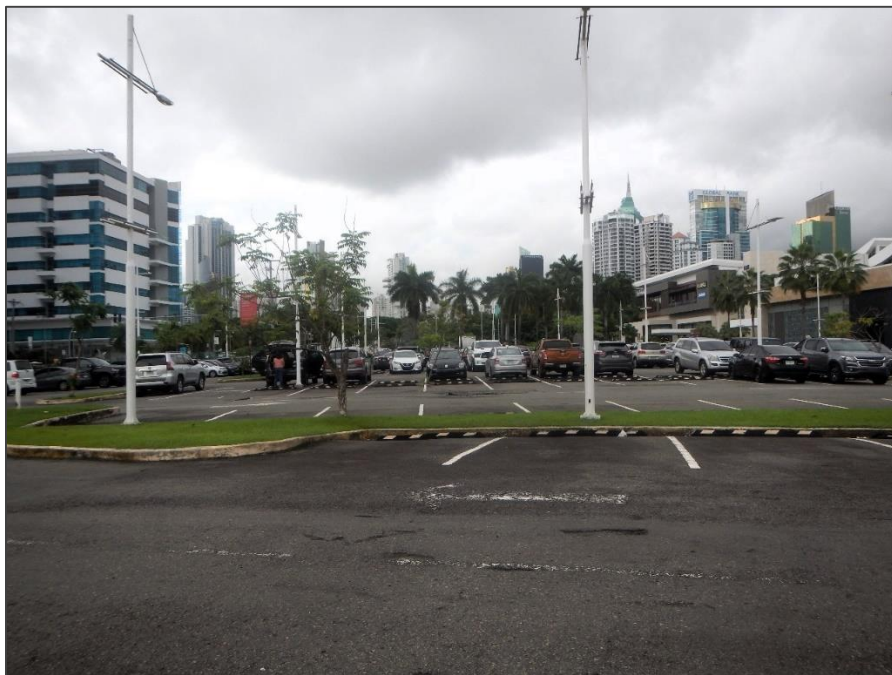
Fotos 2 y 3. Vista panorámica del área colindancia e interna del proyecto, en el sitio se hizo reconocimiento y revisión arqueológico superficial.