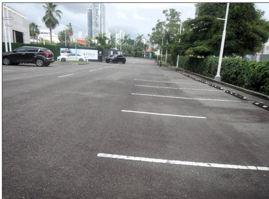
Fotos 8 y 9. Vista dentro del terreno y en la colindancia de proyecto, al fondo, edificios de más de 40 pisos.