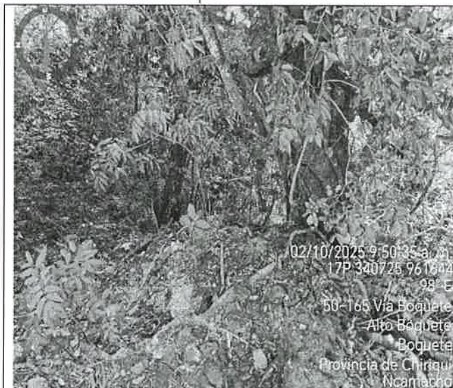
Foto N°3. Vista del fondo de la propiedad, es un barranco con mucha vegetación conformando un bosque de galería del Río Caldera.