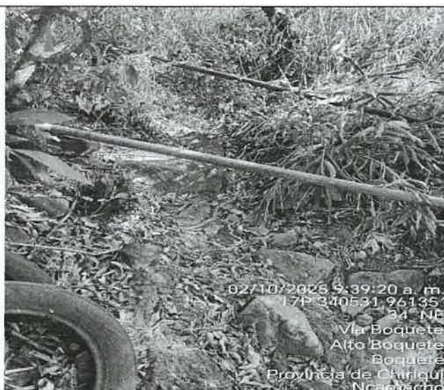
Foto N°4. Vista de un desagüe o paso de aguas de escorrentías en la parte frontal del lote.